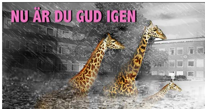
Illustration: Suzane Crepault

”Om Gud fanns skulle Gud visa sig i TV eller på en Youtubekanal”