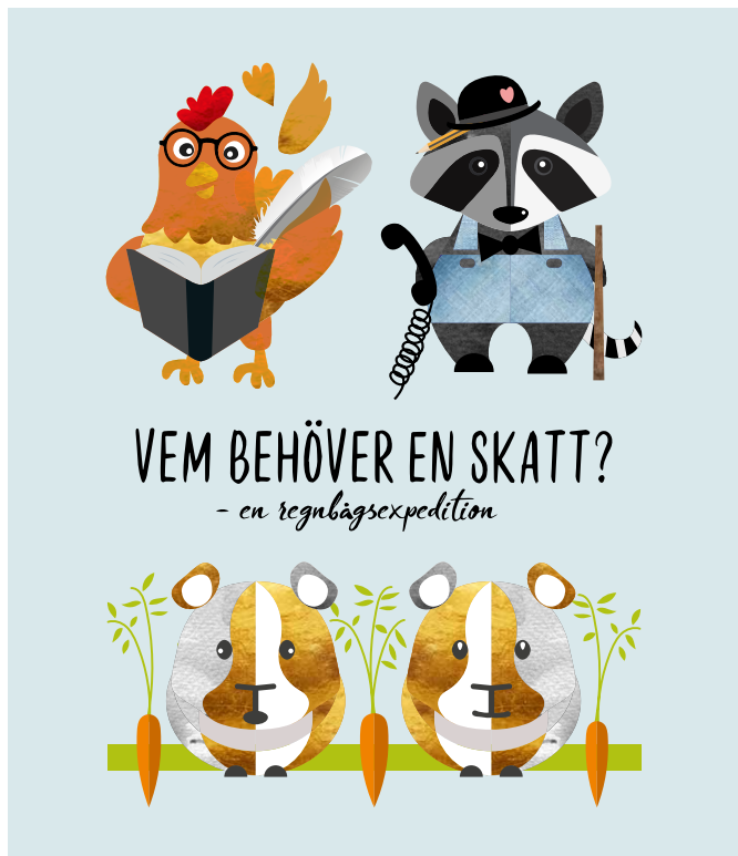
Illustration: Jennie Palmér